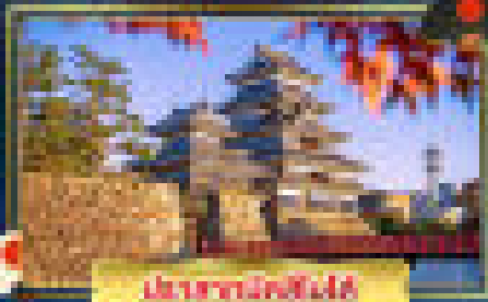
เมืองมัตสึมาตะ

ล่องแก่ง - วิถีชีวิตในคาวาซากิ เมืองมัตสึมาตะ - เที่ยวครบ!! ชมใบไม้เปลี่ยนสีเมือง ฮาคูบะ สัมผัสธรรมชาติอุทยานคามิโคง