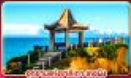
อุทยานแห่งชาติตงผิง

ชมเทศกาลไฟวิญญู ลานของเทศกาลปีใหม่ของ 2027 แช่น้ำแร่ส่วนตัวในห้องพัก