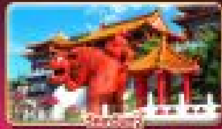
วัดหลงชิว