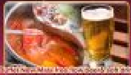
ร้านอาหารจีนแบบดั้งเดิม