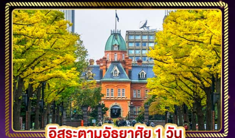
อิซะตามอริยาตัย 1 วัน

น้ำหนักกระเป๋า 20 Kg. บริการอาหาร บนเครื่อง ไป-กลับ