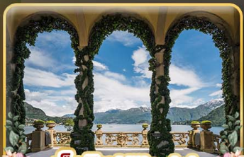
เชคอิน Villa del Balbianello

ที่สุดของธรรมชาติแห่งอิตาลี ทิวเขา ทะเลสาบ ความงามแห่งโดโลไมท์