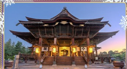
วัดเซ็นโคจิ นากาโนะ