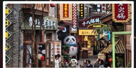
หมู่บ้านสีปาทิ