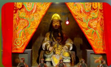
องค์แขกเก่า 600 ปี