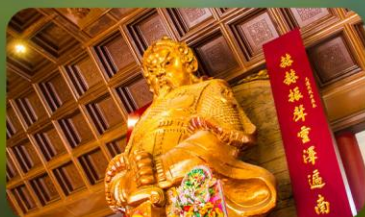
วัดแขกหมิว