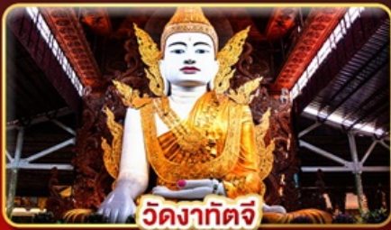
วัดงาทัจ