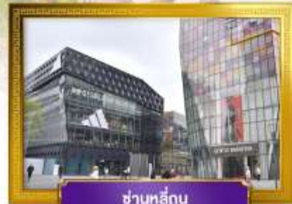
ชานหลู่กู่