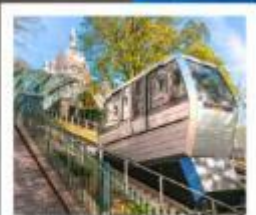
ขึ้นรถรางสู่มงมาร์ต