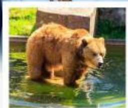
บ่อหมีเมืองเบิร์น