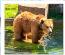
บ่อหมีเมืองเบิร์น