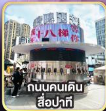
ถนนคนเดิน- สี่牌坊