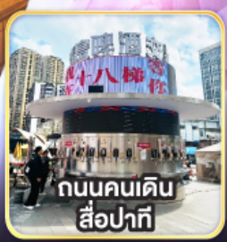
ถนนคนเดิน สี่ปาที้