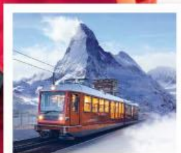
รถไฟเขารอนเนอร์เกรต