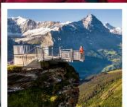
กรีนเดลวาลด์เฟียส