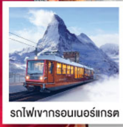
รถไฟเขากรอนเนอร์เกรต