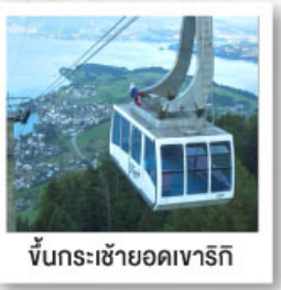
ขึ้นกระเช้ายอดเขาริกิ