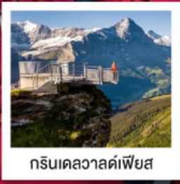
กรีนเดลวาลด์เฟียส