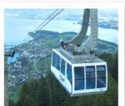
ขึ้นกระเช้ายอดเขาริกิ