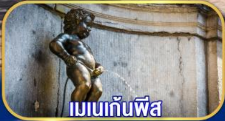
เมเนกันพีล