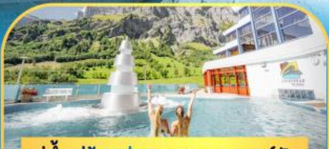
แช่น้ำแร่ร้อนผ่อนคลายลวยคอร์บิต