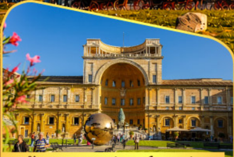
เข้าชมพีพีรภัณฑที่วาติกัน