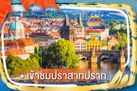
• เข้าชมปราสาทปราก