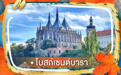
• โบสถ์เซนต์บารา

06-13, 09-16 ต.ค. / 29 พ.ย. - 06 ธ.ค. 69