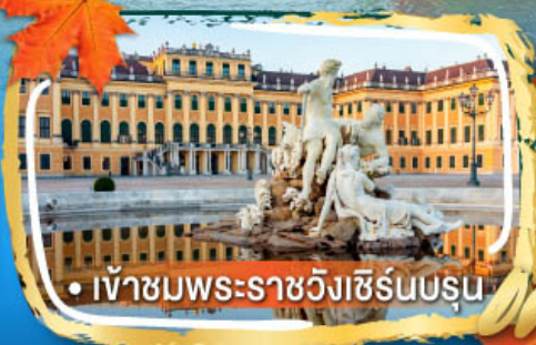
• เข้าชมพระราชวังเซิร์นบรุน