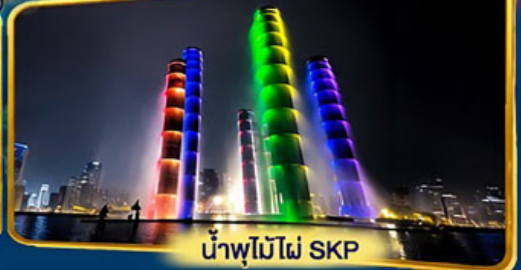
น้ำพุไม้ไผ่ SKP