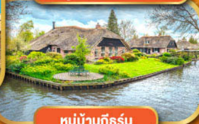
หมู่บ้านกึธร์น