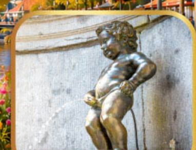
หนูน้อยมานเกินพิส