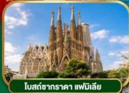
โบสถ์ซากราดา แฟมิลี