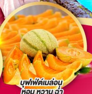
บุฟเฟ่ต์เมล่อน หอมหวานซ่า