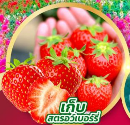
เก็บ สตรอว์เบอร์รี่