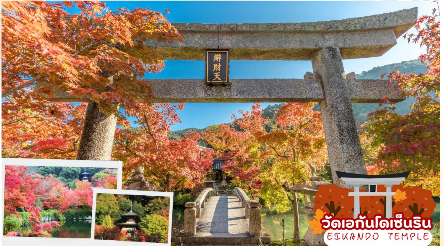
วัดเอกันโดเซ็นริน EIKANDO TEMPLE

ออกเดินทางสู่ เมืองเกียวโต (Kyoto) ซึ่งในอดีตเคยเป็นเมืองหลวงของประเทศญี่ปุ่น และยาวนานที่สุดคือ ตั้งแต่ปี ค.ศ. 794 จนถึง 1868 รวม ๆ 1,100 ปีเลยทีเดียว เมืองเกียวโตจึงเป็นเมืองที่มีสถานที่สำคัญ ๆ ที่เต็มไปด้วยประวัติศาสตร์และวัฒนธรรมดั้งเดิมของญี่ปุ่น