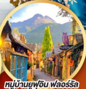
หมู่บ้านยูฟูอิน ฟลอร์ริล