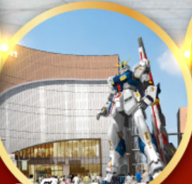
กินคิม ปาร์ค ฟุกุโอกะ