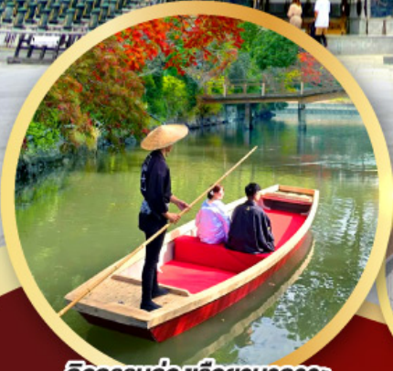
กิจกรรมล่องเรือยามากาวะ