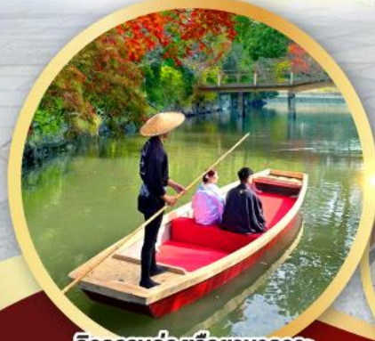
กิจกรรมล่องเรือยามากาวะ