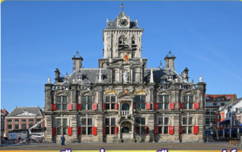
อาคารเมืองเก่าคลองเมืองเคลฟท์