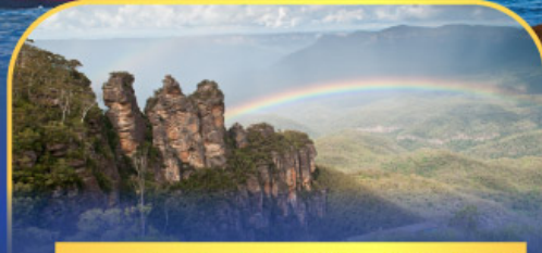
อุทยานแห่งชาติบลูเมาท์เทนส์ Three Sister Rock