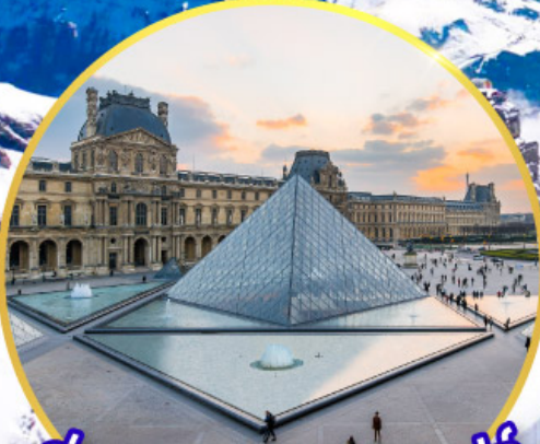
ถ่ายรูปคู่พีพีร์กันที่ลูฟร์