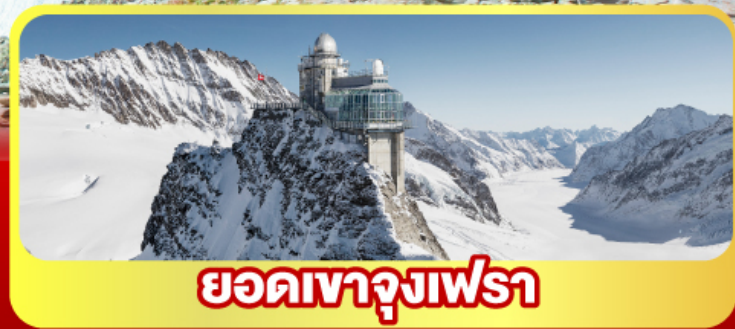
ยอดเทาจุงเฟรา