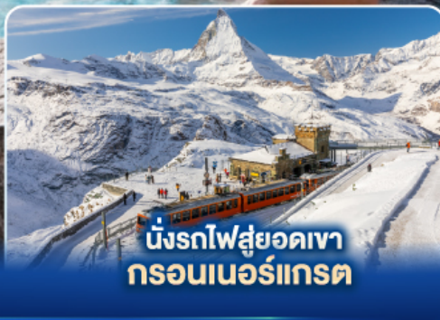
นั่งรถไฟสู่ยอดเขา กรอนเนอร์แกรต