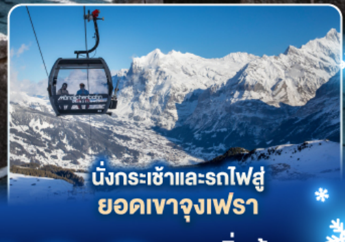
นั่งกระเช้าและรถไฟสู่ ยอดเขาจุงเฟรา