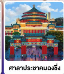
ศาลาประชาคมฉงชิ่ง