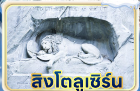
สิงโตลูเซิร์น