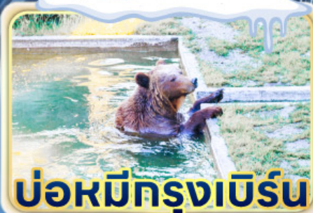
บ่อหมีกรุงเบิร์น