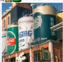
พิพิธภัณฑ์โรงเบียร์ชิงเต่า