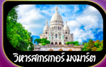
วิหารสกรเกอร์ มงมาร์ต