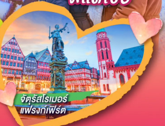
จัตุรัสโรเมอร์ แพรงก์เฟิร์ต