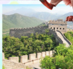
กำแพงเมืองจีนด่านจวิ๊ยกทว