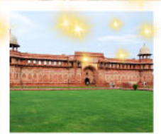
Ajmer Sharif Dargah