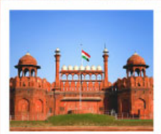
♡♡♡ Agra Fort