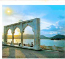
Ana Sagar Lake