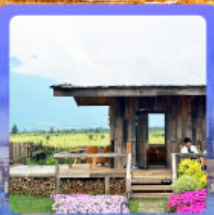
ร้านกาแฟหุบเขาคี๊อัน