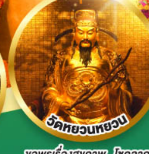
วัดหยวนทวย

ขอพรเรื่องสุขภาพ, โชคลาภ ความเจริญก้าวหน้า