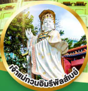
เจ้าแม่กวนอิมรับพลาน์