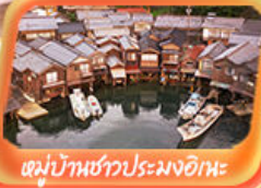
หมู่บ้านชาวประมงอิเะ