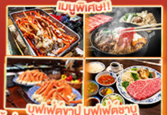
บุฟเฟ่ต์ญี่ปุ่นบุฟเฟ่ต์ซาบู ปิ้งย่างยากิโทโร่ในร้าน Steakland Kobe