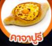
คากาปูร์