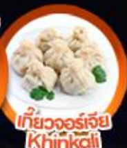
เกี้ยวจอร์เจีย Khinkali