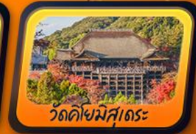
วัดคิโยมิสุเดระ

พักฟูจิออนเซ็น 1 คืน กิฟุ 1 คืน โทยาม่า 1 คืน นาริตะ 1 คืน