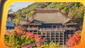
วัดคิโยมิสุตระ