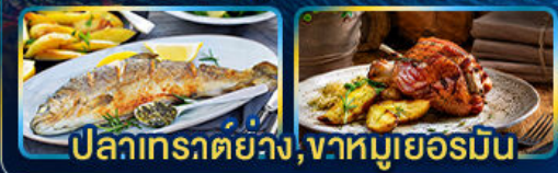
ปลาเทราต์ย่าง, ฆาหมูเยอรมัน

Season Germany Austria Czech of romance.. Slovenia Hungary