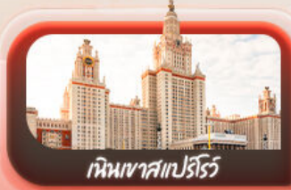
เนินเขาสเปร์โร