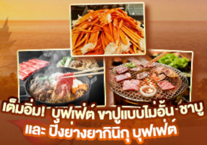
เต็มอิ่ม! บุฟเฟ่ต์ ซาปูแบบโมอิน ซาปู และ ปิงยางยากิniku บุฟเฟ่ต์

สัมผัสความเป็นญี่ปุ่น ชมวิวฟูจิ ครบทุกไฮไลท์เด่นๆ ห้ามพลาด ตื่นตาตื่นใจกับหมู่บ้านมรดกโลกหมู่บ้านชิราคาวาโกะ ขึ้นกระเช้าลอยฟ้าชินโศทากะ ปั่นเซมเบ้เมืองทวอง นารา ขอฟรุตโตโดจิ เชคอินปราสาทโอซาก้า วัดคิโยมิสุเดระ ถ่ายรูปทำซูมิตสึฮิดิ ป้ายกูลิโกะ ปราสาทมัตสึโมโต้ ทะเลสาบซูวะ ชื่นชมศาลเจ้าฟูจิซังเซเนงงุ หมู่บ้านน้ำใสโอชิโนะอากิโก ปิดท้ายช้อปปิ้งย่านดัง ชิบุจุกุ