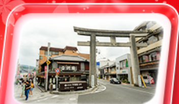
ถนหน้าเชิงว