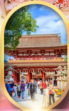
ศาลเจ้าคาโซฟู