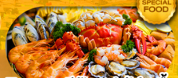
พิเศษเมนู ซีฟู้ดบุฟเฟ่ต์ 1 มื้อ เดินทาง มีนาคม 2569