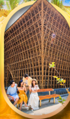
อาคารไม้ไฟ