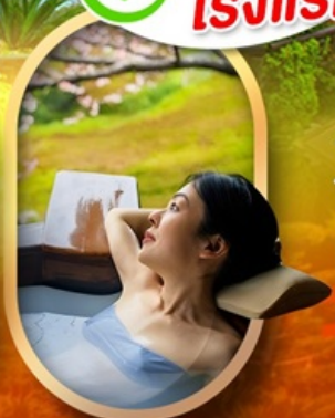
แช่ออนเซ็นญี่ปุ่น