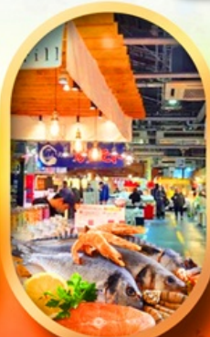
ตลาดปลานิวโอะ