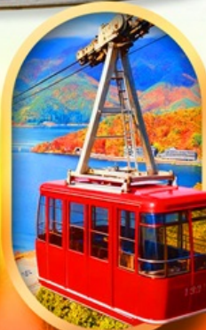
ขึ้นกระเช้าทะเลสาบมิกะตะ