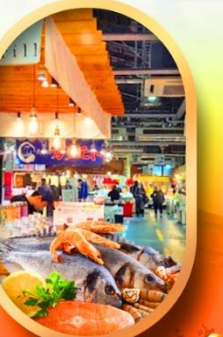
ตลาดปลาโองึกะ