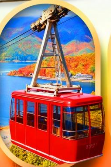
ขึ้นกระเช้าทะเลสาบมิกะตะ