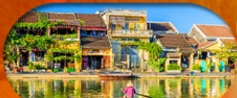
HoiAn Ancient Town ย่านเมืองเก่าฮอยอัน