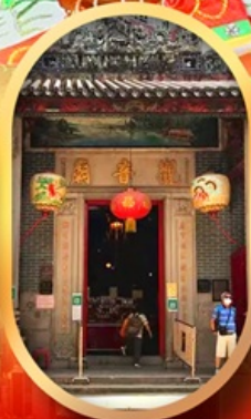
เจ้าแม่กวนอิมสองอ่า