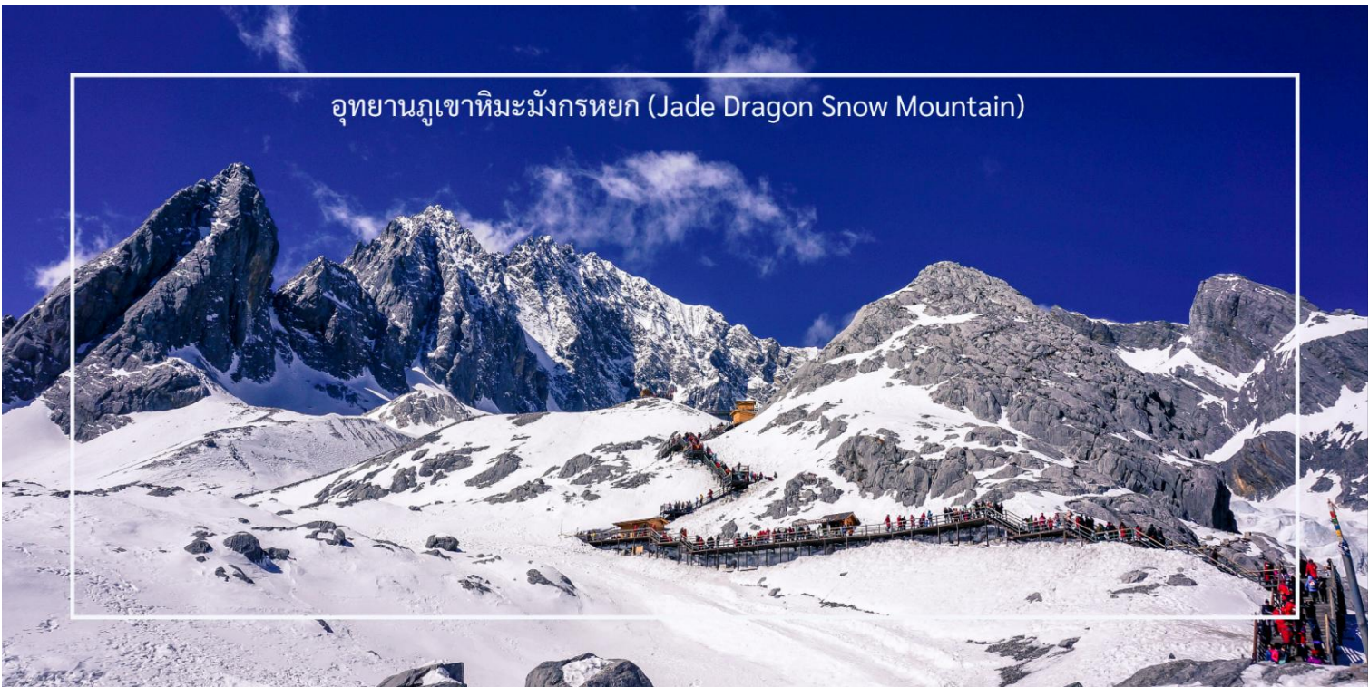
อุทยานภูเขาหิมะมังกรหยก (Jade Dragon Snow Mountain)

การท่องเที่ยวบริเวณภูเขาหิมะมังกรหยกนั้น ถือเป็นจุดที่มีออกซิเจน ที่เบาบางมาก รวมไปถึงระดับความสูง ที่มีอากาศหนาวเย็นและลมแรง ควรเตรียมร่างกายของท่านให้พร้อม และปฏิบัติตามคำแนะนำของไกด์ท้องถิ่น และหัวหน้าทัวร์อย่างเคร่งครัด และควรมีกระป๋องออกซิเจนแบบพกพา เพื่อช่วยเหลือนักเดินทาง ในกรณีที่ท่านมีอาการแพ้ความสูงแบบเฉียบพลัน (หมายเหตุ: กรณีที่มีการประกาศปิดให้บริการกระเช้าไฟฟ้า อันเนื่องมาจากเหตุผลด้านสภาพอากาศไม่เอื้ออำนวย, การปิดซ่อมบำรุง, หรือเหตุผลใดๆ บริษัทผู้จัดขอสงวนสิทธิ์ในการปรับเปลี่ยนโปรแกรมท่องเที่ยวอื่นทดแทน หรือในกรณีที่กระเช้าใหญ่ปิด ทางบริษัทผู้จัด จะเปลี่ยนมาขึ้นกระเช้าเล็กยูนชันผิงแทน โดยไม่ต้องแจ้งให้ทราบล่วงหน้า)